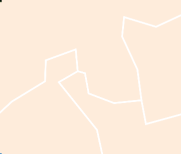
Abbaye de Vignacoul