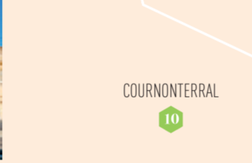
Place de la Comédie