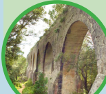
CES saisonnier 07 87 25 67 45