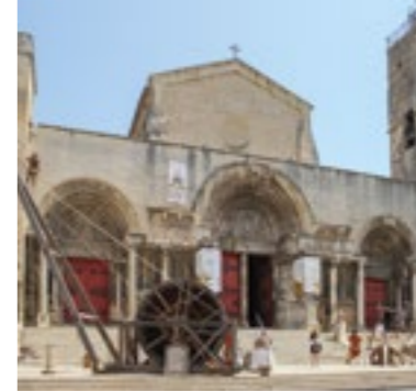
Antigua abadía de Saint-Gilles