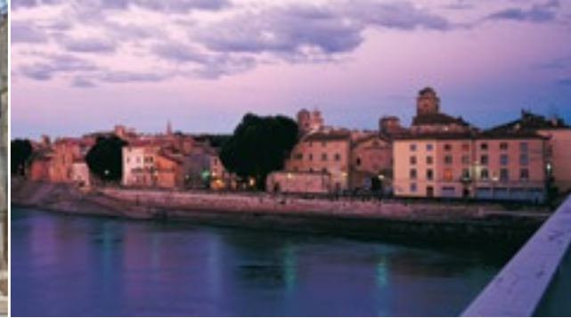
Vista de Arlés y del Ródano