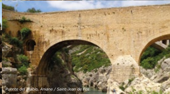
Puente del Diablo, Aniane / Saint-Jean de Fos