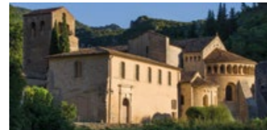
Abadía de Gellone

el puente del Diablo, que resiste desde casi 1000 años a las crecidas del río Hérault.