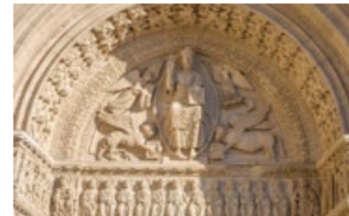
Tímpano de la catedral Saint-Trophime

uno de los más ricos del mundo en capiteles historiados. Su pórtico es una joya del arte provenzal. Éste les abre las puertas del Camino del Sur sobre el trazado antiguo de las vías romanas: de la vía Aurélia a la vía Domitia.