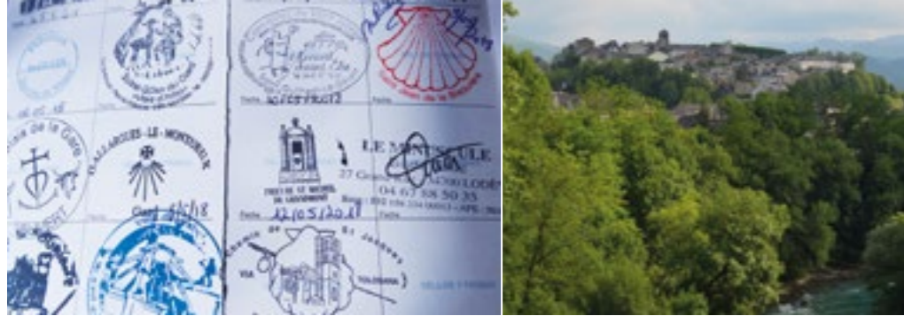
Crédencial, pasaporte del peregrino