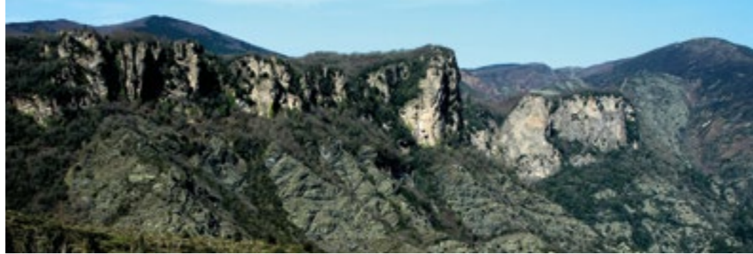
Monts d'Orb cerca de Saint-Gervais-sur-Mare, Hérault