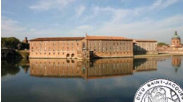
Hôtel-Dieu Saint-Jacques, Toulouse