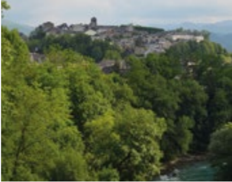
Oloron Sainte-Marie, punto de vista del Gave y los Pirineos