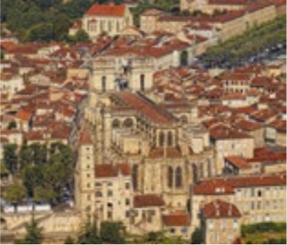
Catedral de Sainte Marie, Auch