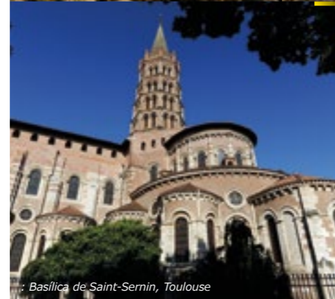
Basílica de Saint-Sernin, Toulouse