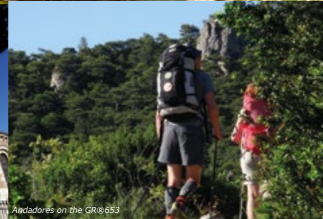
Andadores on the GR®653