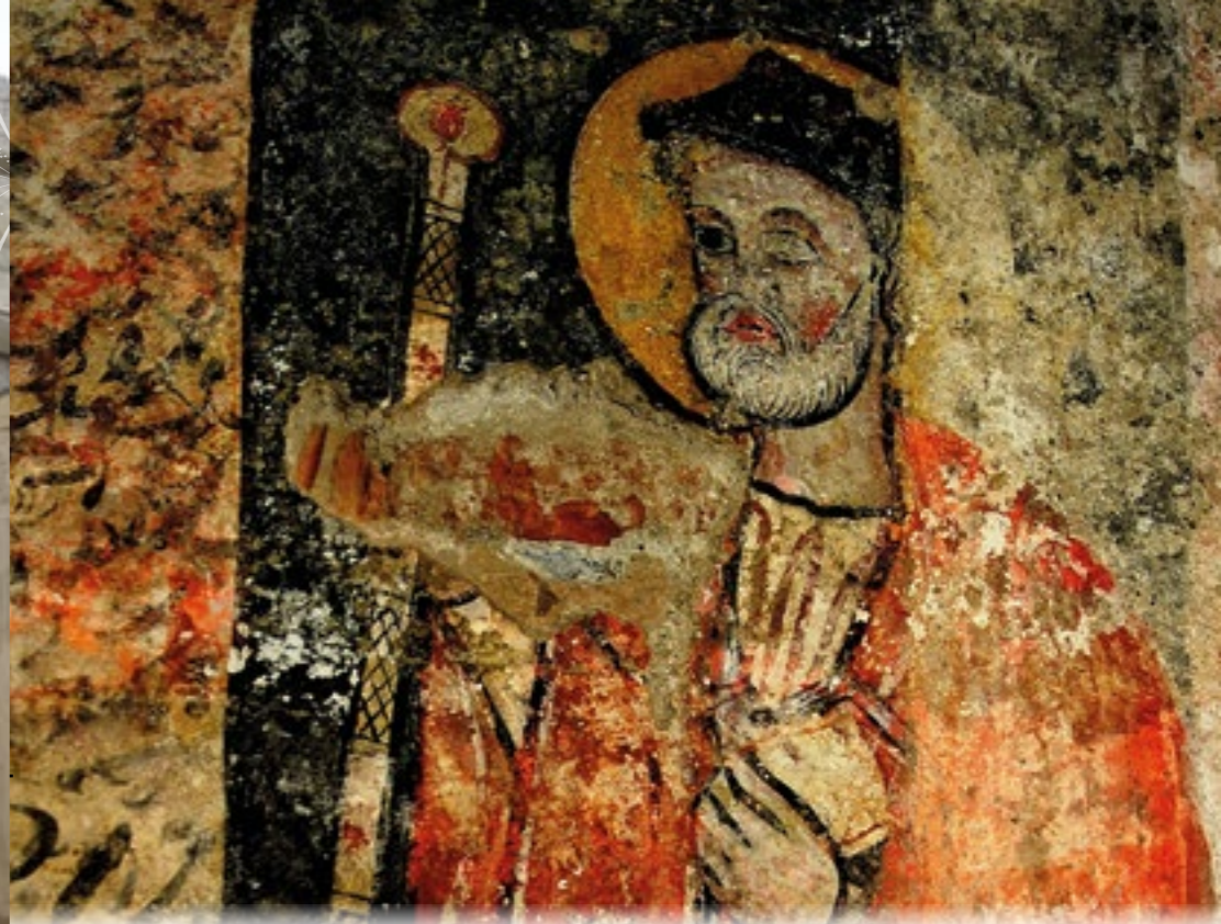
Saint-Jacques, Hotel des Hospitaliers de Saint-Jean-de-Jerusalem, Toulouse